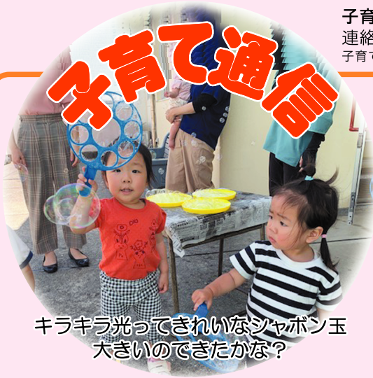
キラキラ光ってきれいなシャボン玉 大きいのできたかな?

旭児童館の幼児部は、みんなでシャボン玉を飛ばして遊びました。夏はプールなど水遊びがうれしい季節になりました。