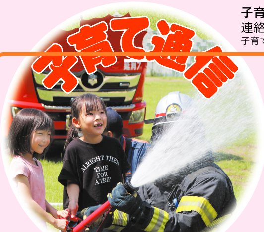
年長さんは放水体験をしたよ 消防車がカッコよかった～

つくしんぼ保育園では9月に消防士さんの指導で総合避難訓練をしました。日頃の訓練が発揮され全員避難できました。